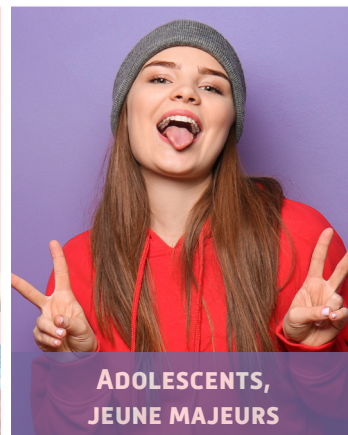
ADOLESCENTS, JEUNE MAJEURS